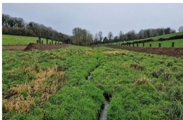
Talus en ceinture de zones humides