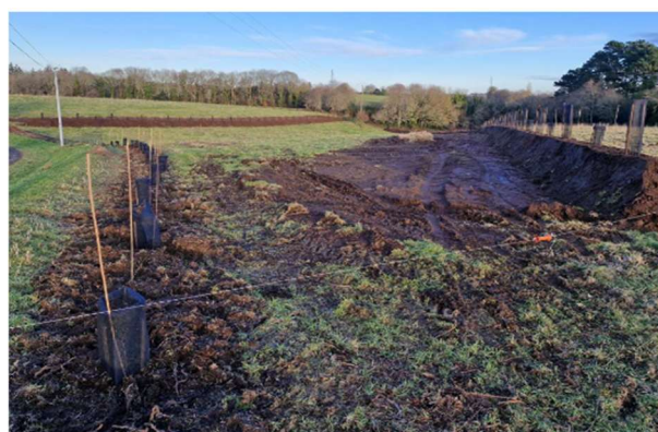
Talus en intra-parcellaire et haies à plat